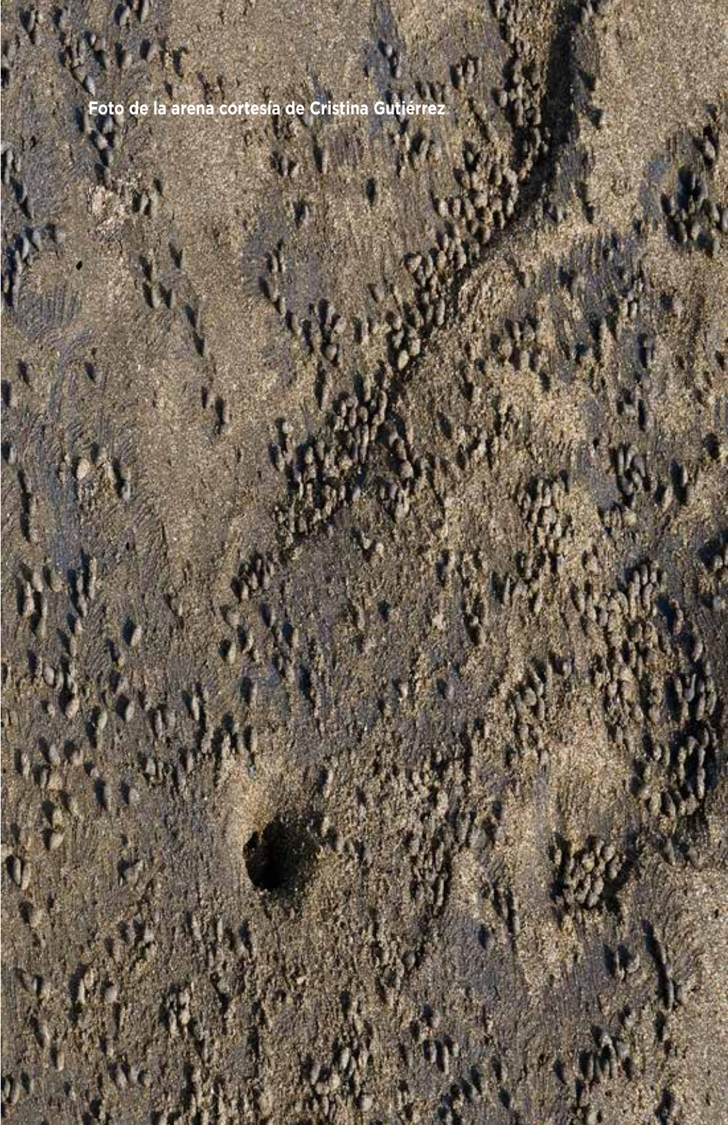
Foto de la arena